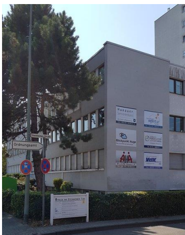
Rückseite Haus am Steinheimer Tor Hanau, Steinheimer Str. 1