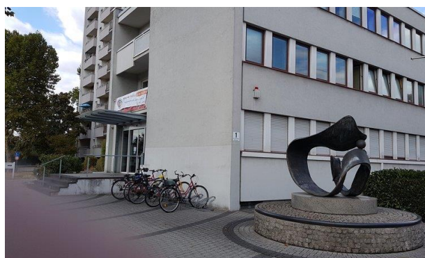
Treppe zum Haupteingang Haus am Steinheimer Tor Hanau, Steinheimer Str. 1